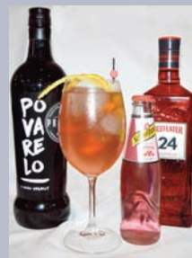
LA BOLSA Noite e Día (Beefeater 24, vermú Povarelo e tónica pink)