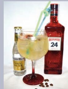
GOTHAM ROCK Kenia (Beefeater 24 mace- rado en café con pomelo)