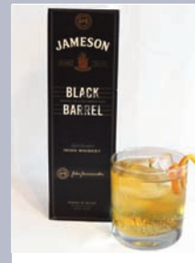
HIBERNIA Black Barrel Jameson, Ginger Ale e twist de laranxa