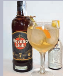
BIANCO Bianco 02