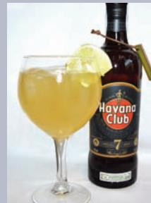
SAMÁ Havana 7 con 7Up e lima