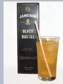
MIÚDO Old Fashioned (citrus old fashioned)