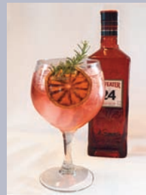
DIURNO Diurno 01