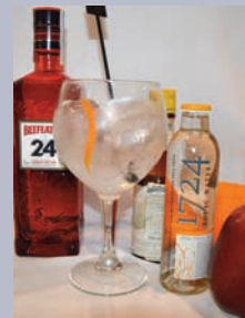
SOLD OUT Gin Sold Out 18 (Beefeater 24, mazá, twist de laranxa, angostura e tónica 1724)