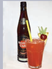
MORLA Montego Bay